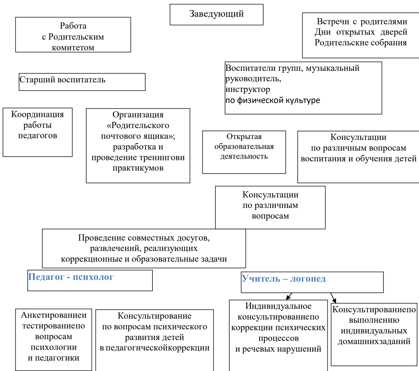
Схема взаимодействия с семьями воспитанников